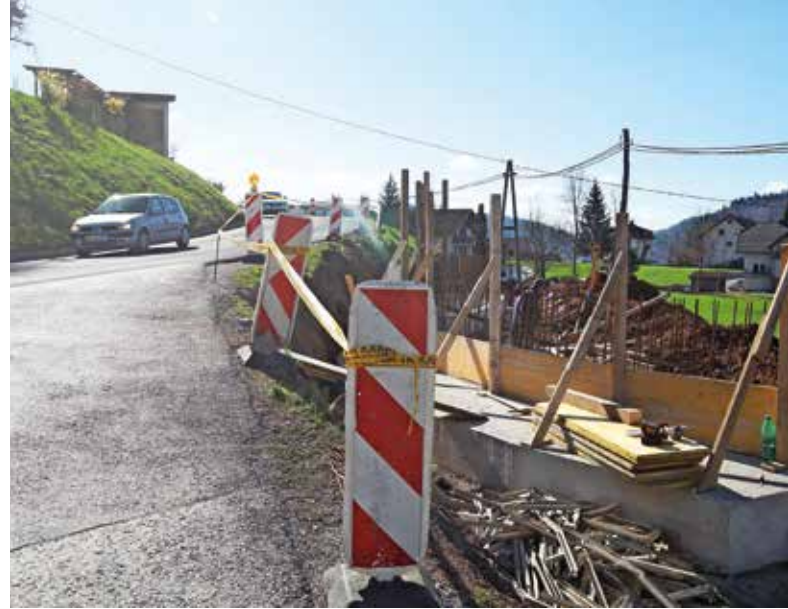
Gradnja pločnikov na Selu

Za obvoznico proti Logatcu pa od države v prihodnjih dneh pričakujejo tehnični pregled in s tem sprostitev prometa po že zgrajeni cesti. V sklopu 2,2 milijona evrov vredne naložbe so poleg novega cestnega odseka v dolžini osemsto metrov in novega križišča pri Pustotniku pridobili tudi nove pločnike in kolesarsko stezo. »Ko bo promet preusmerjen na obvoznico, bo imela Logaška cesta status občinske ceste, in ne več državne. Obenem bo ta cesta po novem prometno manj obremenjena, kar je še zlasti pomembna pridobitev, saj bo kakovost življenja ob njej zdaj bistveno višja,« je poudaril župan. Boljše prometne razmere se obetajo tudi na Selu, kjer bodo nadaljevali obnovo državne ceste in gradnjo pločnikov ob njej, z izvajalcem pa se po županovih besedah poskušajo dogovoriti tudi za vgradnjo cevi za optično omrežje. »Pogodba je že podpisana, in če bodo okoliščine dopuščale, bo cesta zgrajena še letos.« Občina bo za omenjeni projekt zagotovila 170 tisoč evrov. »Najpomembnejše je, da se uredi križišče proti Jarčji Dolini, ki je ta čas zelo nevarno, in seveda zgradijo pločniki za varnejšo pot pešcev,« je še dodal župan.