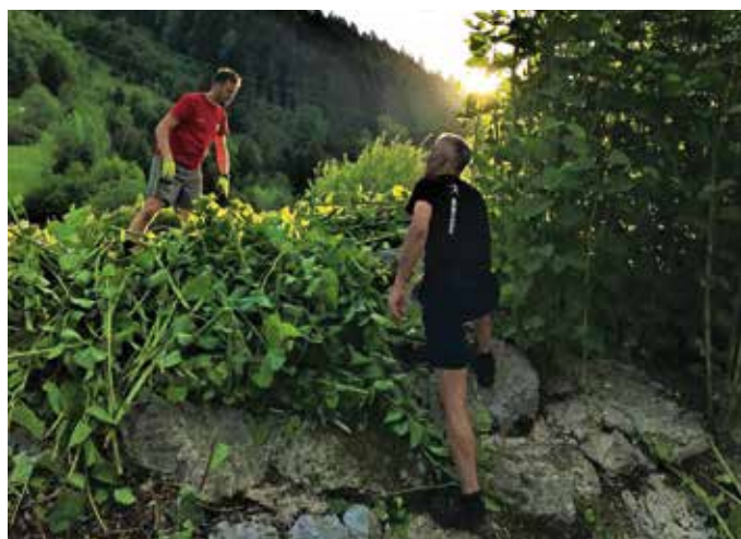
Odstranjevanje japonskega dresnika v Račevi maja lani

V Občini Žiri so o nevarnostih invazivk v preteklosti že ozaveščali v okviru projekta Ljudske univerze Škofja Loka Aktivno proti invazivkam. »Sama ozaveščenost brez ukrepanja na terenu pa invazivk ne ustavi, zato se nadaljujejo aktivnosti za doseg tega cilja,« je poudaril Šubic. Tako v prihodnje načrtujejo osvežitev občinske spletne strani o invazivkah, občanom pa bodo ob skupinskih akcijah odstranjevanja invazivk pomagali z embalažo in odvozom. Po Šubičevih besedah je tudi ravnatelj osnovne šole prijazno sprejel njegov predlog, da učencem razdelijo letake o invazivkah, o tej problematiki in potrebi po ukrepanju pa so se pogovarjali na razrednih