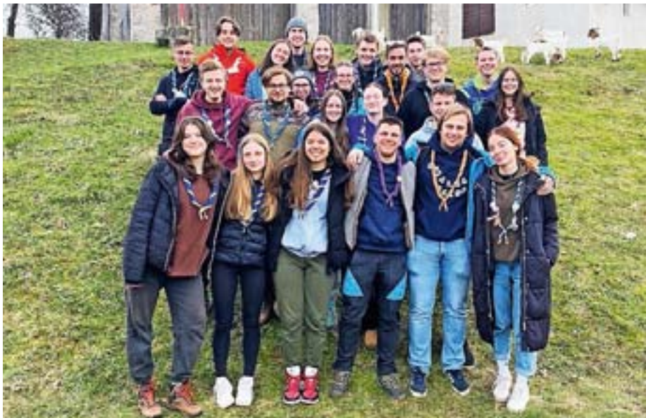
Za žirovskimi taborniki so trije pustolovščin polni meseci.

Medtem ko medvedki in čebelice pridobivajo novo znanje na področju peke kruha, pa drugi taborniki na tekmovanjih dosegajo izjemne rezultate. Kmalu po novem letu se je kar sedem skupin iz našega rodu podalo na že petdeseto orientacijsko tekmovanje Glas svobodne Jelovice, ki je potekalo v Železnikih. Na tem tekmovanju so morali naši taborniki pokazati veliko znanja, saj tekmovanje od nas poleg znanja orientacije po neznanem terenu zahteva tudi znanje prve pomoči, taborništva in bivanja v naravi. Tekmovanja so se udeležile tri ekipe gozdovnikov in gozdoznic (starostna skupina od 6. do 9. razreda osnovne šole), dve ekipi popotnikov in popotnic (od 16. do 21. leta), ena mešana ekipa raziskovalcev in raziskovalk ter grč (od 21. do 27. leta ter od 27. leta naprej), ter ena ekipa grč (nad 27 let). Vse skupine so pokazale veliko znanja in vzdržljivosti. Vod Hobotnice pa si zasluži prav posebno pohvalo, saj so dekleta osvojila prvo mesto v kategoriji gozdovnikov in gozdoznic. Na progi, po kateri so prišli s pomočjo orientacije, so dosegli najhitrejši čas in dosegli nadpovprečen rezultat na topografskih in drugih tematskih testih. Žirovski taborniki se vsako leto odpravimo na tekmovanje Glas svobodne Jelovice ter tam dosegamo izjemne rezultate. Tako so letos tudi v kategoriji