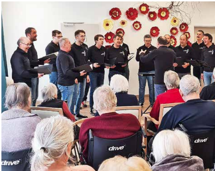
Ob dnevu žena so tako stanovalke kot zaposlene doma SeneCura Žiri razveselili člani Moškega pevskega zbora Alpina Žiri.

Seveda pa na tako lep praznik nismo pozabili na drobno presenečenje za vse stanovalke. Obdarili smo jih z ročno izdelanimi vrtnicami, ki so nastale izpod spretnih rok naših stanovalcev in stanovalk. Stanovalkam je tako vrtnico izročil kar naš stanovalec. Ob tej priložnosti se iskreno zahvaljujemo članom Moškega pevskega zbora Alpina Žiri. Naj njihova ljubezen do glasbe traja in naj velja, kot smo dejali na našem skupnem srečanju: Pridite še kdaj, veseli vas bomo!